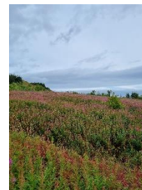
Mynd 4 – Skurðurinn á vettvangi en hér sést líka hversu mikill gróður er á svæðinu.