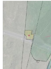
Mynd 3 – Garðurinn sést hér á túnakorti frá 1920.