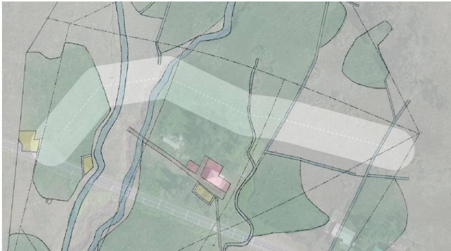
Mynd 7 - Túnakort Kirkjubólssels frá 1920 lagt ofan á loftmynd. Strenglöggnin sést með ljósri brotalinu.