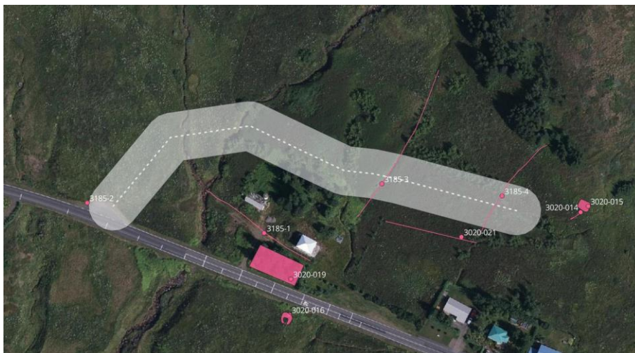
Mynd 6 – Mynd af úttektarsvæðinu með skráðum minjum. Verkefni 3020 stendur fyrir eldra skráningarverkefni strenglagnarinnar sem var unnin árið 2023.

Fjórar fornleifar eru þekktar í nágrenni strenglagnarinnar. Gata 3185-2, garður (3185-3), skurður (3185-4) og skurður (3185-5). Af þeim er strengurinn fyrirhugaður þvert yfir báða skurðina og teljast þeir því í stórhættu.