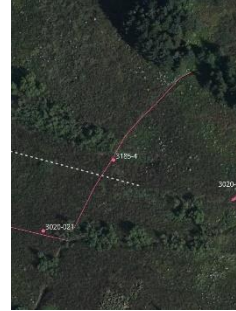
Mynd 5 – Skurðurinn með loftmynd undir.