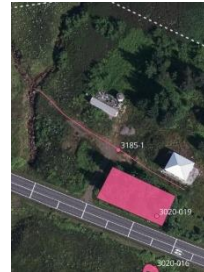
Mynd 2 – Gatan sést hér á loftmynd.