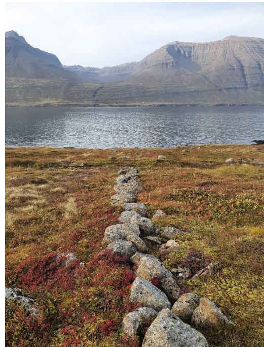
Mynd 5. Steinar undan landamerkjagirðingu [3131-003], horft í norður.

Hleðslan er undan landamerkjagirðingu milli Krossstekkjar og Kross. Lengst af var Krossstekkur talinn með heimajörðinni Krossi en í Mjófirðingasögu II (Vilhjálmur Hjálmarsson 1988, bls. 89) segir: „Nokkru áður en Suðurbyggð lagðist í eyði var farið að telja Krossstekk sjálfstæða jörð. Landamerki við Kross voru um Sandfjöru og við Reyki eins og segir í landamerkjabréfi Krossjarðar frá 13. Júlí 1890.“