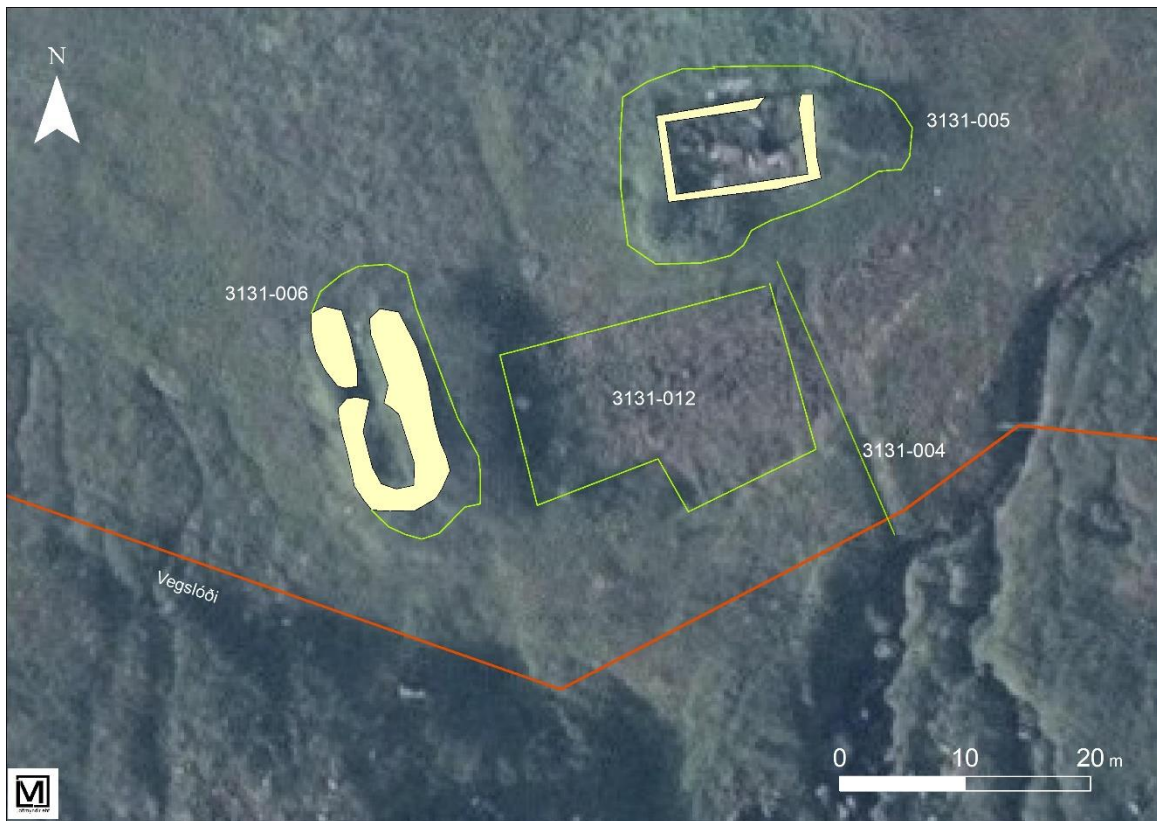
Mynd 6. Yfirlitsteikning af minjum efst í túni á Krossstekk.