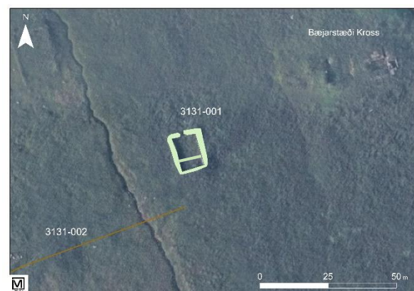
Mynd 3. Yfirlitsteikning.

Í örnefnaskrá Kross (bls. 13) segir: „Skammt utan við Bæjarlæk, ofan við götu var Hólshús og Hólshlaða.“ Á örnefnakorti hjá Landmælingum er hinsvegar tóft innan við bæjarstæðið neðan götu