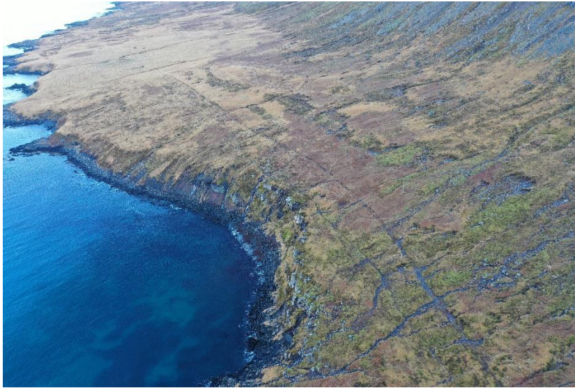
Mynd 4. Horft til austurs að bæjarstæði Kross. Sjá má ruddan vegslóða fyrir miðri mynd og eldri götu vinstra megin nær fjörunni.

kölluð Hólshlaða. Þetta passar ekki við lýsingu í örnefnaskrá en á túnakorti má sjá byggingu ofan við Hólshús. Vera kann að það hafi verið Hólshlaðan en þarna er nú einungis sléttuð flöt í túni.