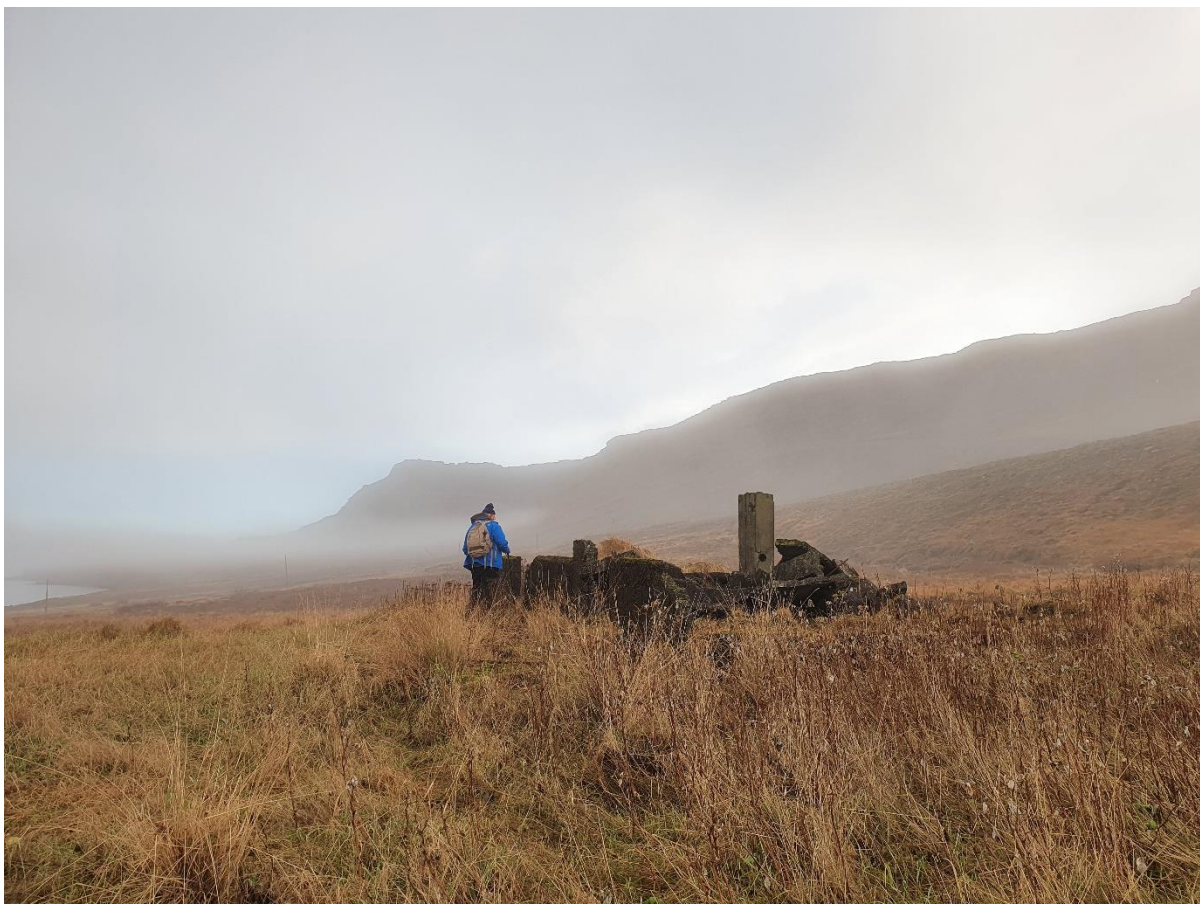
Mynd 7. Horft til austurs yfir leifar yngsta bæjarins á Krossstekk.