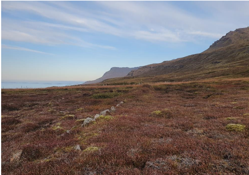
Mynd 10. Horft í austur yfir túngarð [3131-009] efst á Gilsártanga.