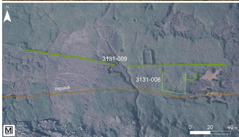
Mynd 9. Á efri myndinni má sjá staura sem enn standa eftir af Gilsártangarétt og hægra megin við þá er slóðin sem verður löguð, horft í austur. Neðri myndin er afstöðumynd af minjunum.