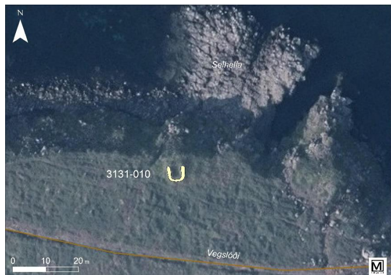
Mynd 11. Yfirlitsteikning af sjóhúsi ofan Selhella.