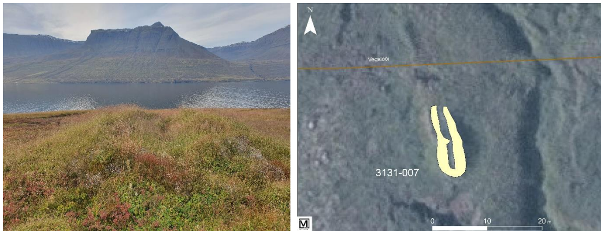
Mynd 8. Stekkur eða heytóft [3131-007].

Heimildamaður Ólafur Wium taldi líklegt að þarna hefði verið fjós.