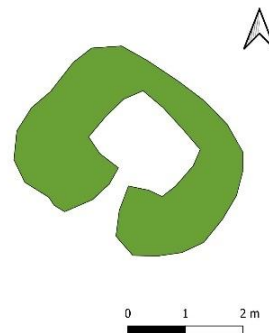
Mynd 9. Uppmæling af tóft [3061-6].