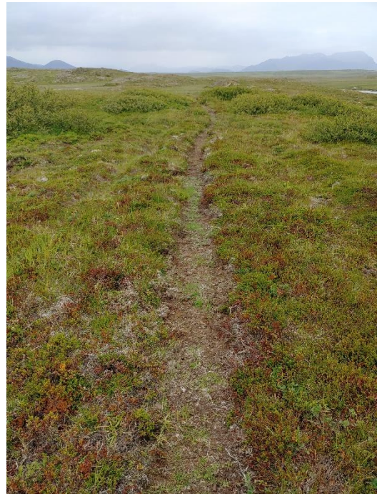
Mynd 1. Dæmi um kindagötu/götu á svæðinu, horft til vesturs.