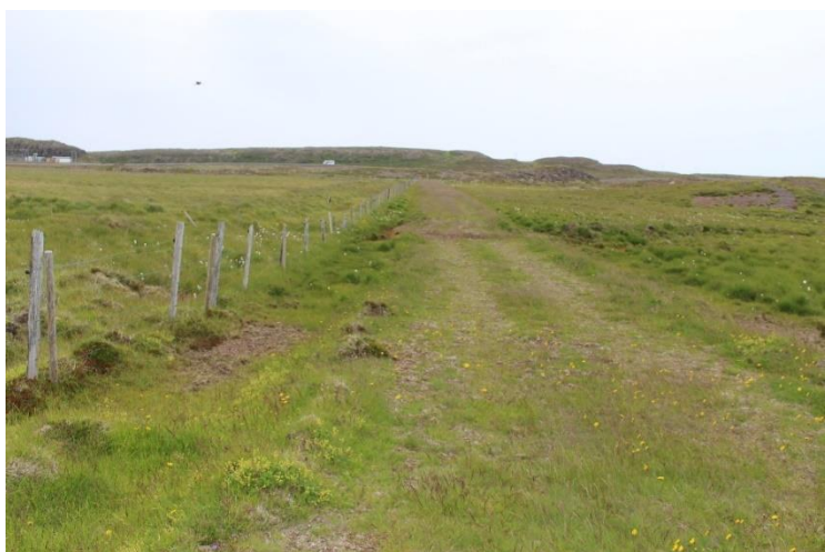
Mynd 12. Gamli þjóðvegurinn [3061-7] horft til NNV í átt að Vogaskeiðum.