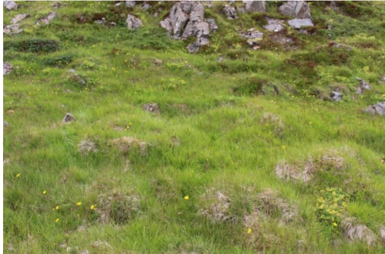
Mynd 10. Tóft [3061-6], horft til austurs.

Ekki er um stekkin sem Stekkjarholtið heitir eftir að ræða því hann er vestan við veginn, Grjótstekkur kallaður, utan lands Saura 9. Ekki er þó loku fyrir það skotið að þessi tóft tengist stekknunum á einhvern hátt.