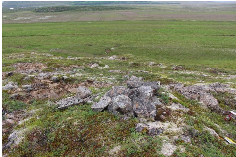
Mynd 8. Varða [3061-5], horft til suðurs.

Varðan er mest um 20 cm há og um 1x0,6 m að grunnfleti. Varðan er mjög hrunin og sigin og sjást steinar í kring sem gætu verið hrun úr henni. Hleðsla vörðunnar sem stendur er í raun einungis eitt umfar. Steinar eru stórir og meðalstórir og fléttugrónir.