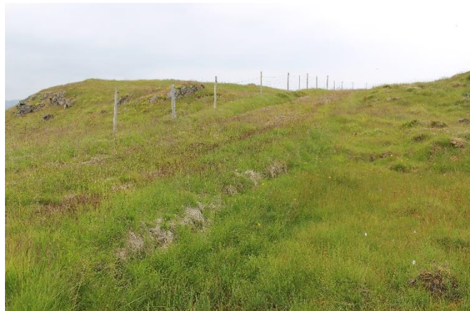
Mynd 11. Gamli þjóðvegurinn [3061-7] horft til norðvesturs þar sem vegurinn liggur vestan við Stekkjarholt. Sést í smá upphleðslu í kantinum næst á myndinni.

aðalveginum út á Þórsnes, en það gerist í það minnsta fyrir árið 1924. Áður hafði vegurinn legið austar (Þorleifur Jóhannesson 1926:48). Vegurinn var þjóðvegur út á Þórsnesið fram undir