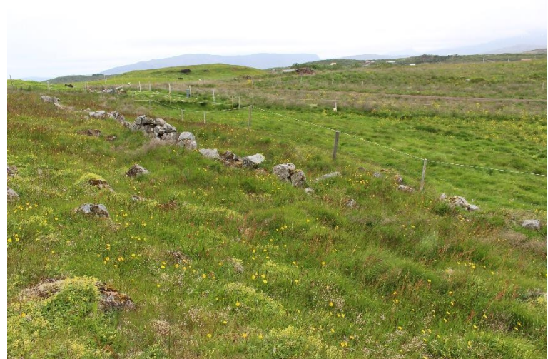
Mynd 19. Norðurhluti garðlags [3061-12], horft til ASA.

tekið úr hleðslum, sér í lagi að austan, en garðlagið er ekki heilt þar. Mjög stórt grjót myndar norðurhlið og hluta austurhliðar garðlagsins. Vestur og suðurhlið eru lægri og yfirgrónari, og hluta komin inn á tún. Girðing liggur sunnan við norðurhlið garðsins og er tún sunnan hennar. Garðlagið hefur líklega afmarkað svæði á einhverjum tímamarki, verið rétt eða garður. Miðað við staðsetningu er garðlagið í túnjaðri eða jafnvel utan túns miðað við túnakort frá 1916 en er ekki merkt inn á það kort.