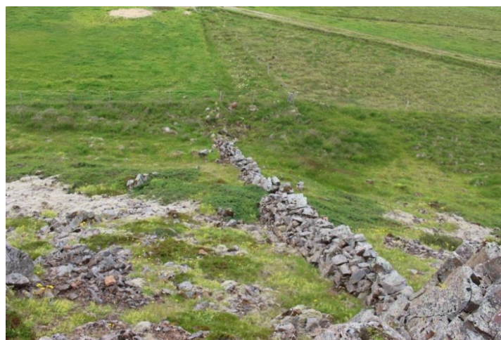
Mynd 16. Garðlag [3061-19], horft til suðurs.

Garðlagið er víðast ekki haganlega hlaðið en er þó ansi stæðilegt. Hæð þess er um 0,4-1,1 m og það er mest um 1 m breitt. Í garðlaginu er mest