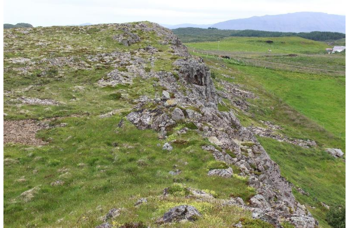
Mynd 18. Garðlag [3061-11] u.þ.b. fyrir miðri Borginni. Horft til austurs. Garðlagið er ógreinileg lína rétt innan við klettabrúnina.

Hleðslan er mjög sokkin og ógreinilega á köflum en annars staðar greinileg. Hæst er hún um 40 cm en yfirleitt lægri. Breiðust er hún um 80 cm austast, en yfirleitt mun mjórri. Grjótið er stærra austast en yfirleitt minna þegar upp á Borgina er komið og vestureftir henni. 1-2 steinaumför sjást og eru steinarnir yfirleitt fléttu- og mosagrónir. Hleðslan heldur áfram inn í land Norðuráss.