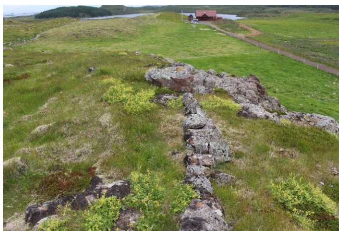
Mynd 17. Garðlag [3061-11] austarlega á Borginni, horft til austurs, Norðurás í baksýn.

Á blábrún Borgarinnar norðvestan við bæjarstæði Saura, nokkurn veginn alla leiðina með brúninni og niður af henni austanmegin er lág hleðsla/steinaröð, líklega undirhleðsla undan girðingu.