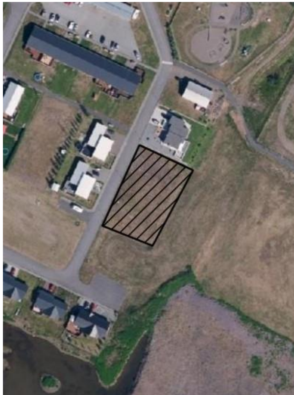
Mynd 1 – Úttektarsvæðið.

Um er að ræða fyrirhugaðar byggingarframkvæmdir innan skipulags. Undirbúningur lóðanna hefur hafist fyrir einhverju síðan. Af loftmyndum frá miðri síðustu öld af dæma virðist svæðið hafa verið undir vatni.