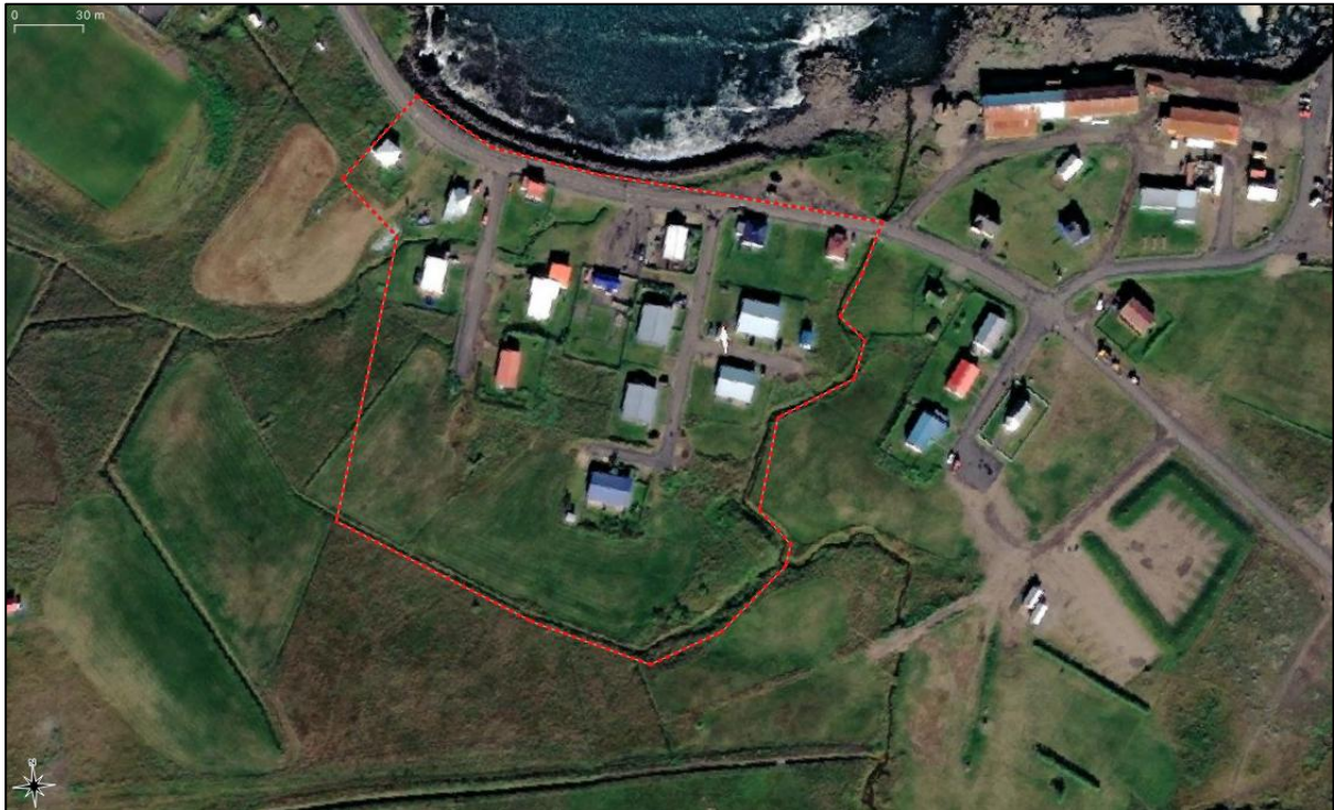
Mynd 1. Deiliskipulagssvæðið að Borgarfirði eystra.

Víkurnes 1 og 2, Dagsbrún 1 og 2 og Breiðvangur 1 og 2. Á skra.is sést að gert er ráð fyrir fimm lóðum á svæðinu, þ.e. Lækjarbrún, Lækjargrund og Smáratúni. 1