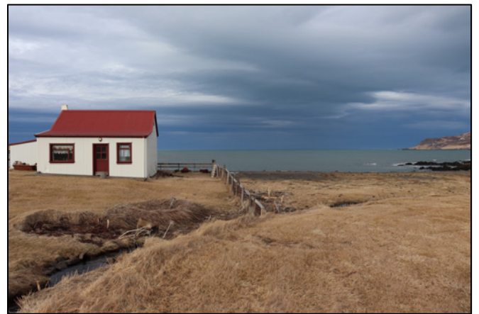
Mynd 7. Horft til NA, til vinstri á mynd má sjá Jörva. Við hlið Jörva, til A, stóð Bergsstaður (Eiríkshús) nr. 2754-4.

2754-3. Þóreyjarkofi-Þúfa. Torfbær, byggður