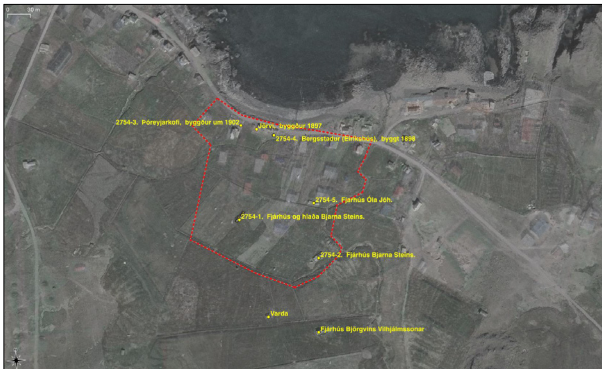
Mynd 9. Yfirlitsmynd yfir minjar sem skoðaðar voru á svæðinu.

Útihús Bjarna Steins nr. 2754-1 (rústir standa enn) og nr. 2754-2 teljast ekki minjar skv. skilningi laga nr. 80/2012 þar sem talið er að þær byggingar hafi verið reistar rétt fyrir 1940. Minjarnar voru mældar upp eða hnitsettar og ljósmyndaðar sem teljast fullnægjandi mótvægisáðgerðir á þessu stigi málsins til að hægt verði að gæta að varðveislu minjanna við áframhaldandi vinnu við deiliskipulag. Niðurstaða fornleifaskráningarinnar er því sú að nægjanleg varðveisla teljist vera að skrá heimildir um húsinn á deiliskipulagssvæðunum sem um getur hér að framan. Það er þó ákvörðun Minjastofnunar Íslands með hvaða hætti varðveislu eða frekari rannsóknum skuli vera háttað.