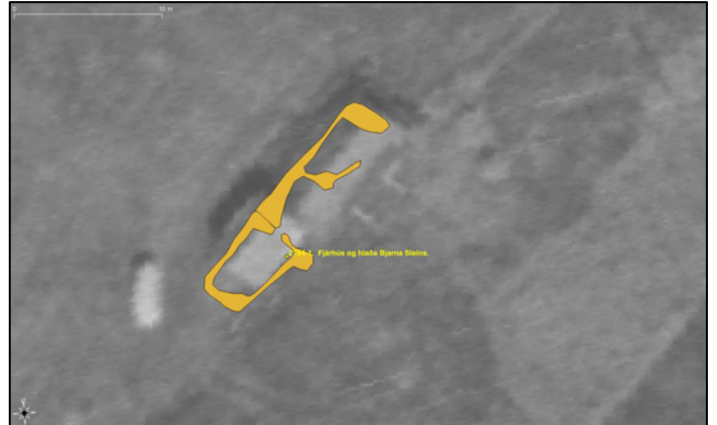
Mynd 5. Rústir tóftar 2754-1 eins og þær voru mældar upp á vettvangi. Undir uppmælingu er loftmynd frá 1955.