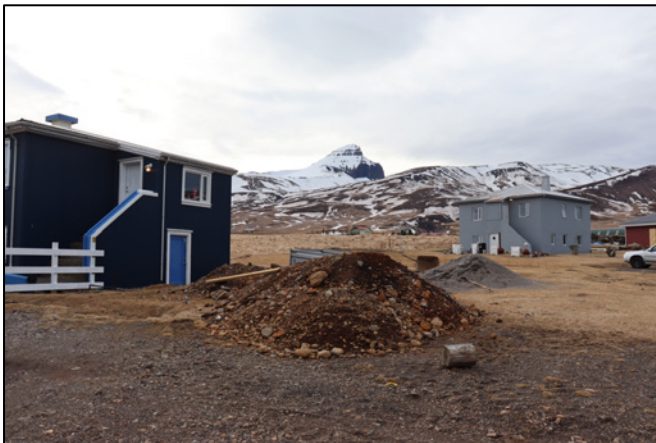
Mynd 6. Horft til NV þar sem 2754-3, Þóreyjarkofi stóð.