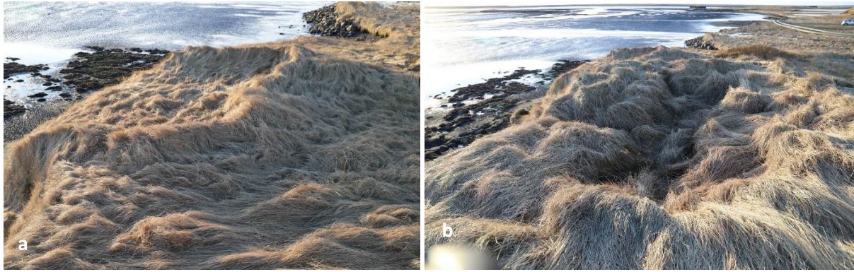
Mynd 6 a og b. a) Garðlag 001, horft til suðvesturs. b) Vestasta fjárhústóftin (002) horft til suðvesturs.