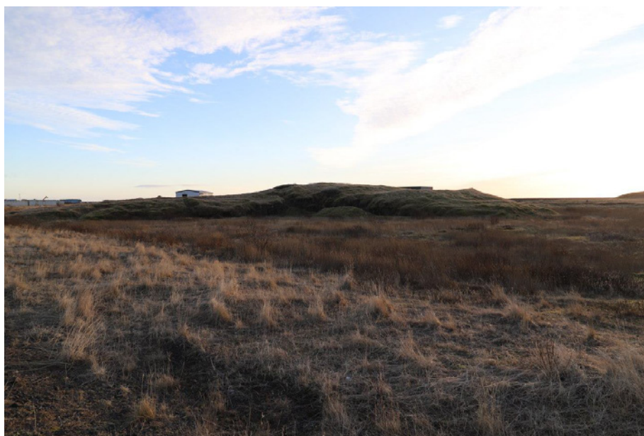
Mynd 10. Ytri-Ferjuklettur, meint skipalægi frá gamalli tíð samkvæmt gömlum sögnum.

Lýsing: Landfyllingar milli Hafnartangans og Óslandssvæðisins frá seinni hluta síðustu aldar gera það að verkum að nærumhverfi Ferjukletta er gjörbreytt frá því sem áður var. Ytri-Ferjuklettur rís 3-4 m frá jafnsléttu en ekki sést lengur í Innri-Ferjuklett (sjá mynd 10).