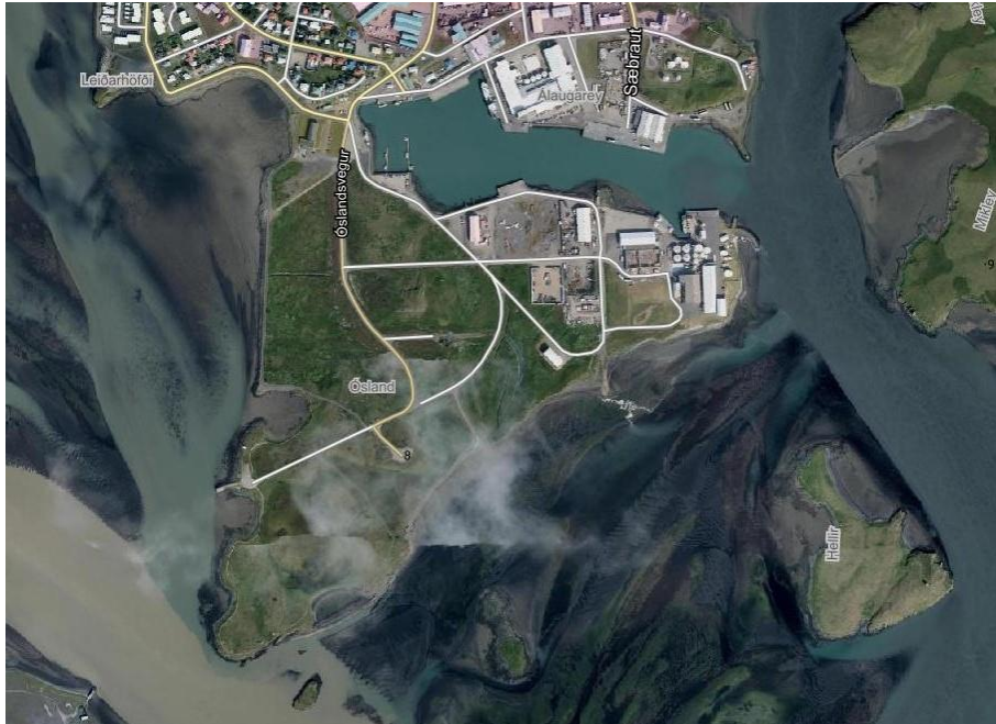
Mynd 3. Ósland og hafnarsvæði Hornafjarðarhafnar árið 2017. Landfyllingar hafa gjörbreytt ásýnd og landsháttum í Óslandi. Skjákot af kortavefsjá Sveitarfélagsins Hornafjörður. Loftmyndagrunnur: Loftmyndir ehf.