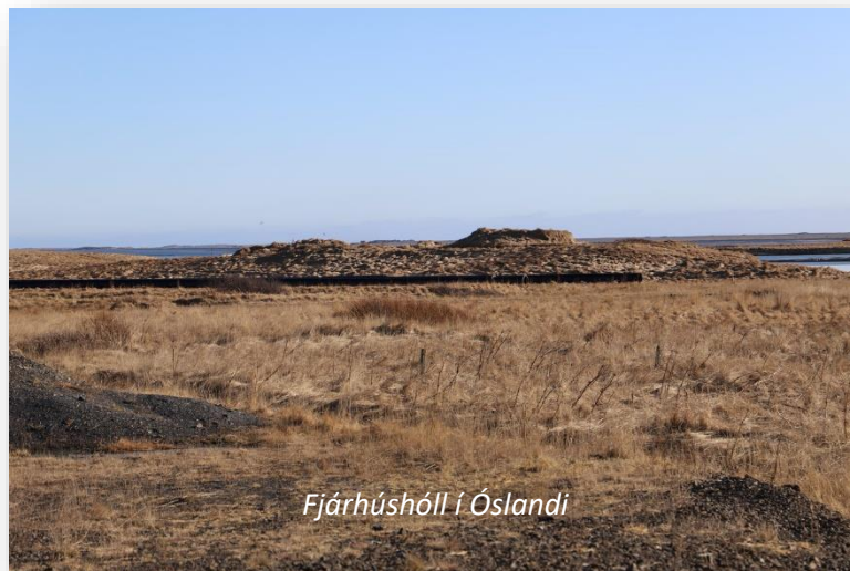
Fjárhúshóll í Óslandi