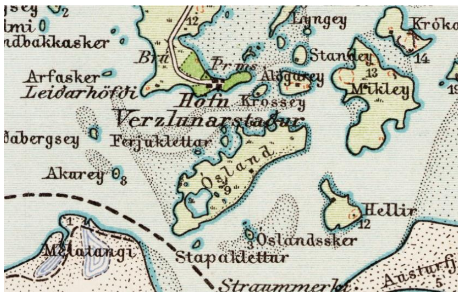
Mynd 2. Skjáskot af Herforingjaráðskorti Dana byggt á landmælingum þeirra frá 1903. Kortið sýnir landshætti við Hafnartangann við upphaf byggðar á Höfn í byrjun 20. aldar. Ósland var stakstæð eyja sunnan tangans, engjaland í eigu Hornsbænda.