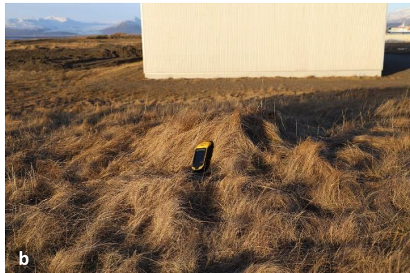
Mynd 9 a og b. a) Gönguslóðinn austur með Fjárhúshólnum. b) Mögulegt vörðubrot austarlega á Fjárhúshól.