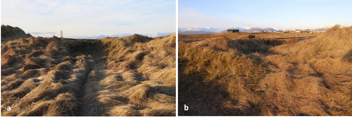
Mynd 7 a og b. a) Tóft 003, fjárhús eða garður, horft til vesturs. b) Aðhald 004, horft til norðurs.

Lýsing: Mannvirkið er U-laga með veggum úr torfi og grjóti. Innst í tóftinni hefur rofnað skarð í hleðsluna og er steinn sýnilegur í sári rofsins. Ytra mál mannvirkis er 6 x 4 m og er mikið gróið (sjá mynd 7a). Gönguslóði liggur í gegnum mannvirkið og áfram austur með Fjárhúshólnum. Hlutverk þessa er ekki ljóst en ekki er útilokað að veggirnir eru leifar tveggja garða.