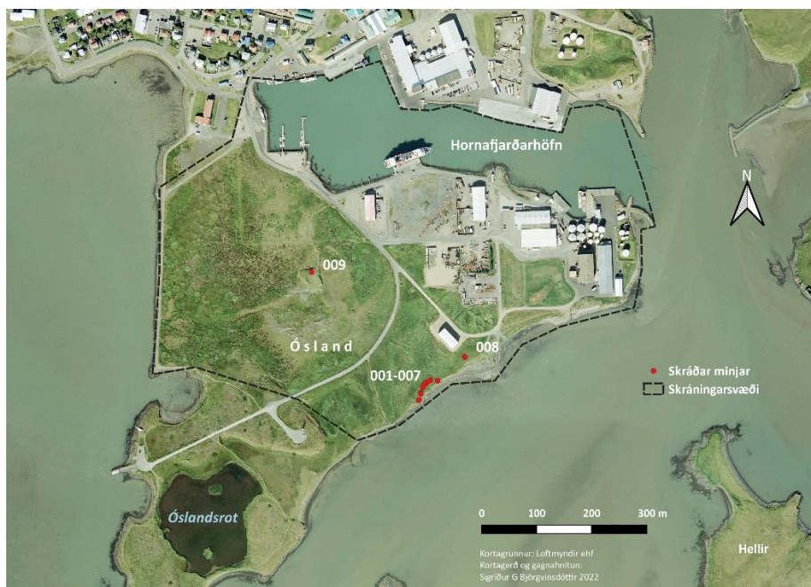
Mynd 4. Skráðar minjar í Óslandi, rauðir punktar varpað á loftmynd Loftmynda ehf. Svört strikálína afmarkar skráningarsvæðið. Sjá nánar í skráningu hér neðar.

Niðurstaða skráningar í þessu verkefni er sýnd á mynd 4. Skráningin hlaut verkefnanúmerið 2746 hjá Minjastofnun og myndar stofn í auðkennisnúmeri hverrar minjar. Samtals voru skráðir 9 minjastaðir á vettvangi.