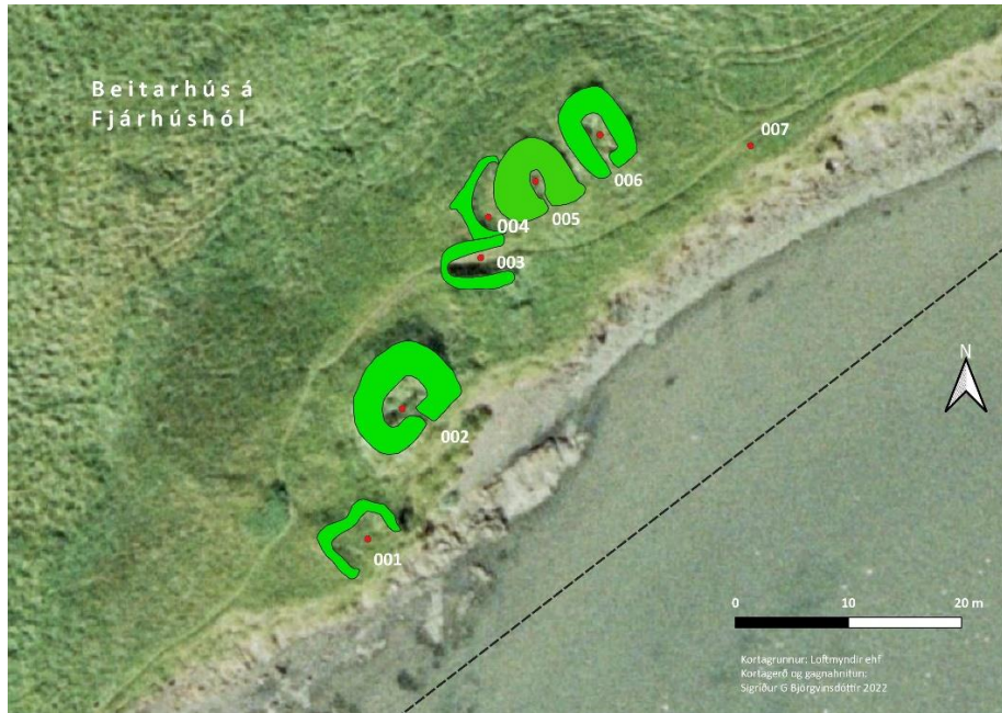
Mynd 5. Uppmældar tóftir beitarhúsa á Fjárhúshól í Óslandi, varpað á loftmynd. Sjá skráningu 001-006 í fornleifaskrá hér neðar. Loftmyndagrunnur: Loftmyndir ehf.