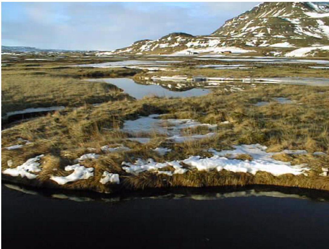
Mynd 2. Myllan skammt hjá Björnstorfulind.

Í mikilli hættu eru fimm staðir, þar af fjórir vegna hinnar fyrirhuguðu vegagerðar. Í lítilli hættu eru tveir staðir, þar af einn vegna vegagerðarinnar og í engri hættu eru þrír staðir (sjá mynd 1).