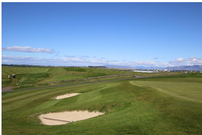
Séð yfir garðinn til norðurs