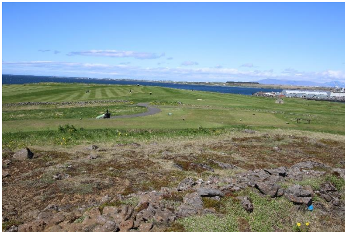
Séð yfir götuna til norð- vesturs.