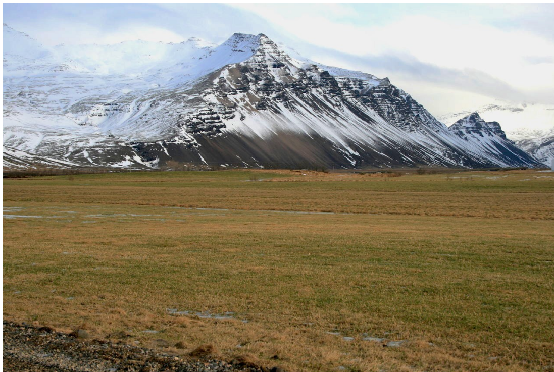
Mynd 8. Túnin sunnan við bæjarhlaðið, horft af heimkeyrslu til austurs. Ljós. SGB, feb. 2019.