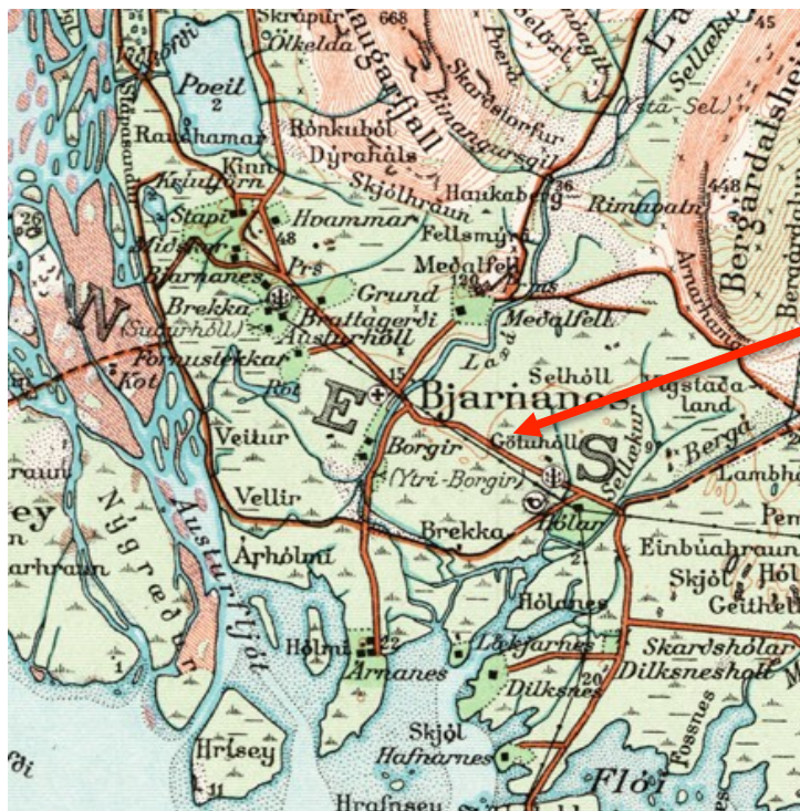
Legu þjóðvegjar frá 1913