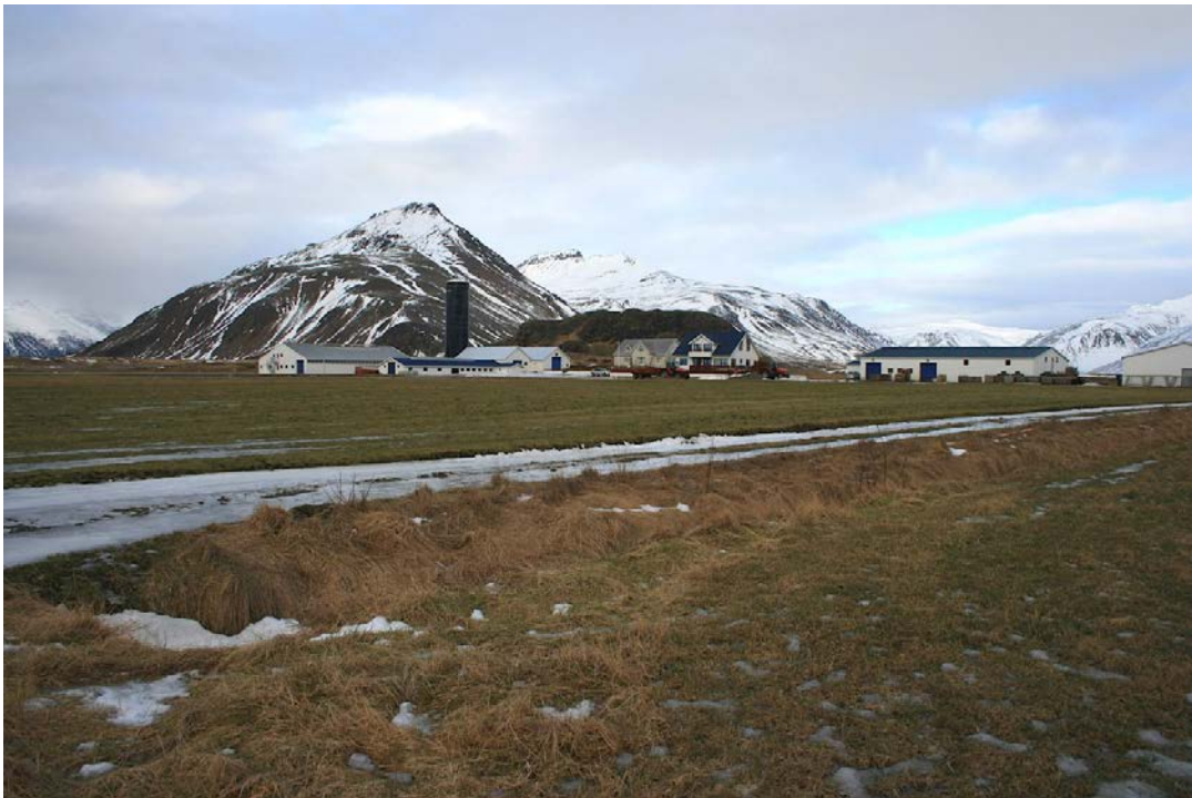
Mynd 2. Horft til norðurs að bæjarhlaði Seljavalla I og III, með skipulagssvæðið í forgrunni. Ljós. SGB, feb. 2019.

Bæjarnafnið Seljavellir er dregið af örnefninu Selhóll, sem er lágreistur hóll um 500 m norðaustan við bæjarstæðið. 4 Búseta að Seljavöllum hófst árið 1955 þegar nýbýlið var reist í fornu heiðar--- og beitilandi Árnanes. 5 Árnanesjörðin var talin ein af bestu jörðum í fyrrum Nesjahreppi með mikil og góð engjalönd auk hlunninda. 6 Jarðamörk Seljavalla liggja frá Þjóðvegi 1 í suðri til marka afréttar við Selmýrarhrygg í norðri, samsíða landareign Akurness í vestri og Klettabrekku/Dýhól í austri. Kartöflu--- og rófurækt er stunduð á Seljavöllum ásamt landbúnaði og ferðaþjónustu.