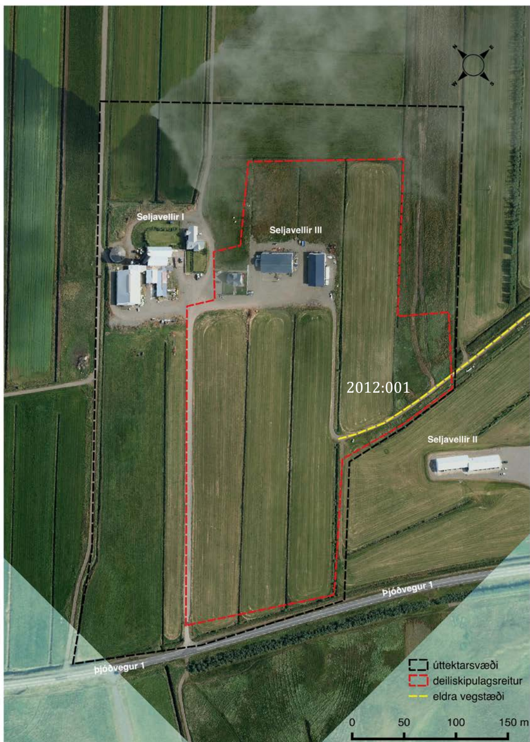
Mynd 6. Myndkort er sýnir úttektarsvæðið varpað á loftmynd. Kortagerð: SGB, feb. 2019.