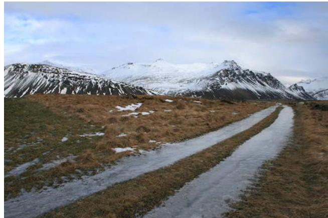
Mynd 5. Eldri þjóðvegurinn, byggður á árunum 1910---1913.

Lýsing: Milli Seljavalla og Hóla liggur um 1,5 km langur kafli af gamla þjóðveginum, u.þ.b. 300 m norðan við núverandi þjóðveg. Vestasti hluti hans nær 130 m inn fyrir skipulagssvæðið. Vegurinn er gróinn milli hjólfara og ekki að sjá að hann sé í mikilli notkun, annarra en landeigenda. Vegurinn hverfur síðan undir tún Seljavalla III (mynd 5).