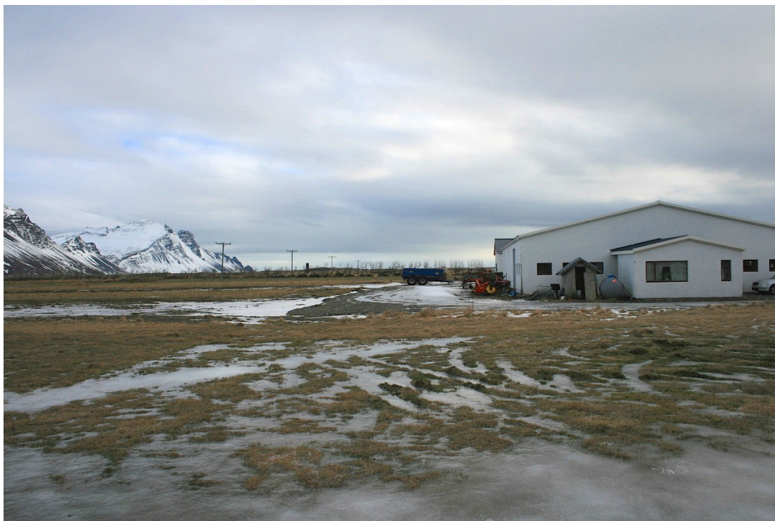
Mynd 7. Horft til suðausturs norðan bæjarhúsanna. Ljós. SGB, feb. 2019.