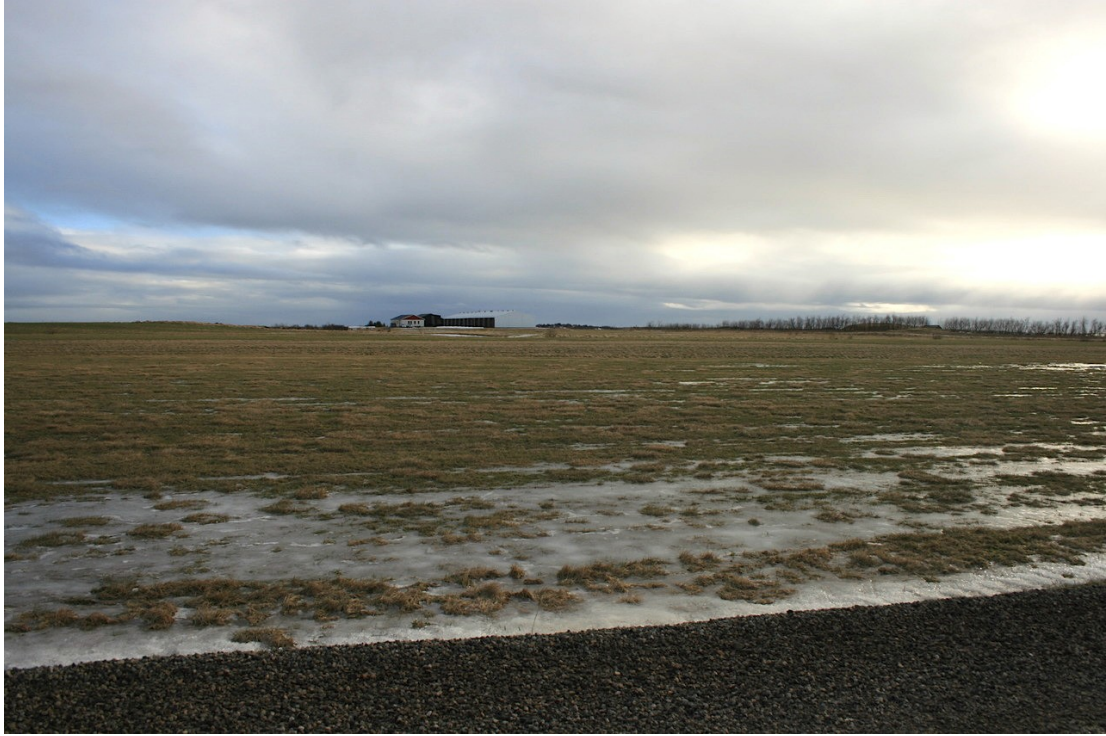
Mynd 9. Horft til suðurs yfir skipulagsreitinn í átt að Seljavöllum II. feb. 2019.