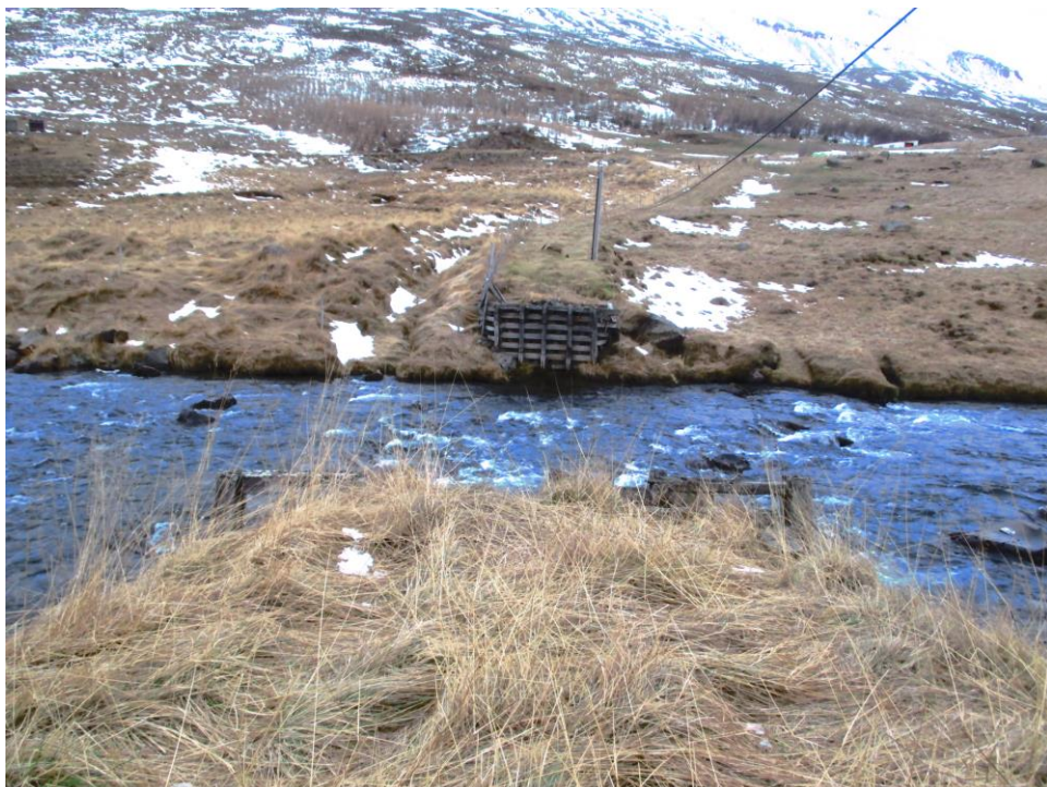
Mynd 2 Horft til vestur að vegstæðinu í landi Hólsgerðis. Vaðið er til hægri við brúarfótinn.