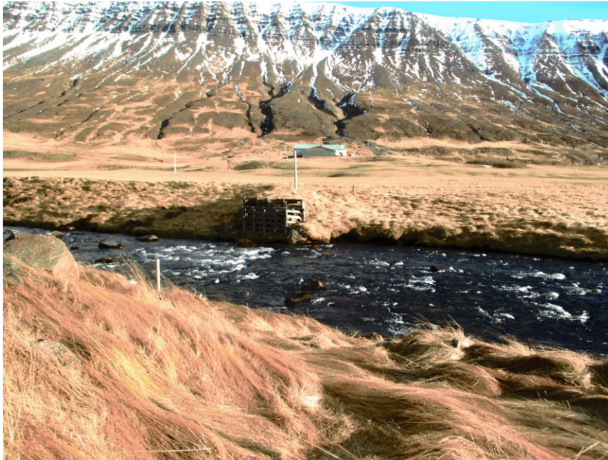
Mynd 3 Horft til austurs að Tjörnum, vaðið til vinstri við brúarfótinn.

örnefnaskrá og fornleifaskráningu fyrir Hólsgerði er Stekkjarvað yfir Eyjafjarðará yfir í land Tjarna.