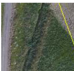
Kort 2. Kort yfir minjar í landi Hólsgarðis.