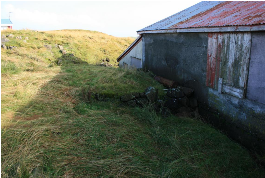
Mynd 4. Grjóthleðsla sem liggur upp að norðurvegg hlöðunnar. Horft til austurs. (Ljós. SGB, okt. 2016).