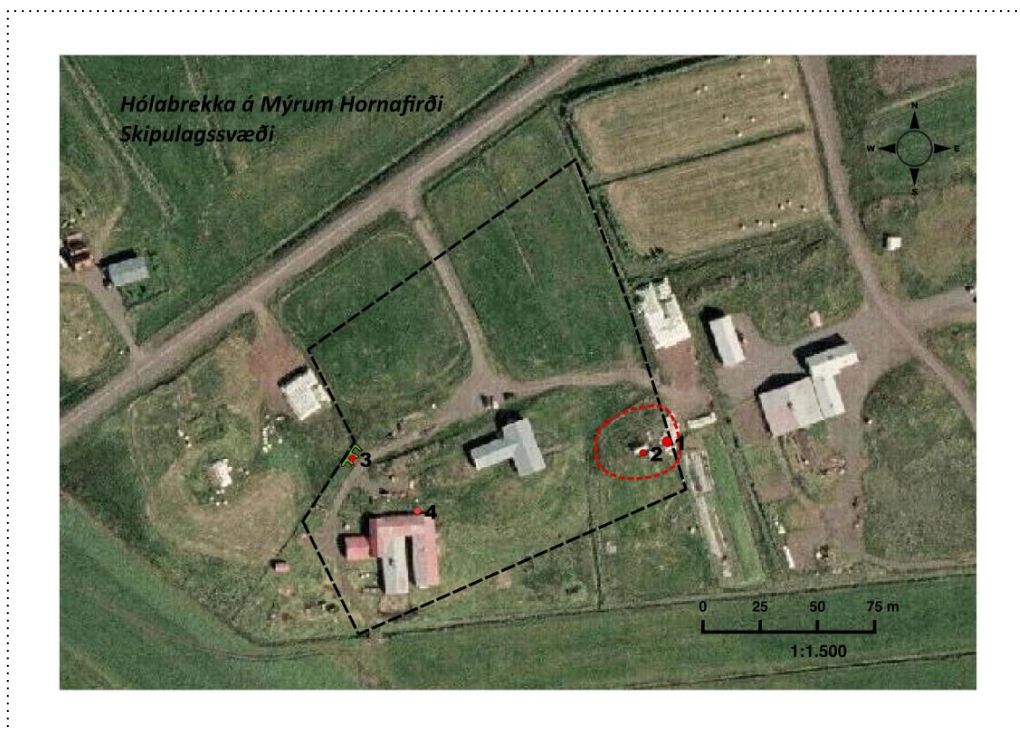
Kort 2. Skráðar minjar á bæjarhlaði Hólabrekku á loftmynd frá Loftmyndum ehf. Svartur rammi afmarkar skipulagssvæðið samkvæmt uppdrætti af korti 1. Rauður hringur sýnir eldra bæjarstæðið.

Sjá hér að neðan kort 2: afstaða minja við framkvæmdasvæðið.