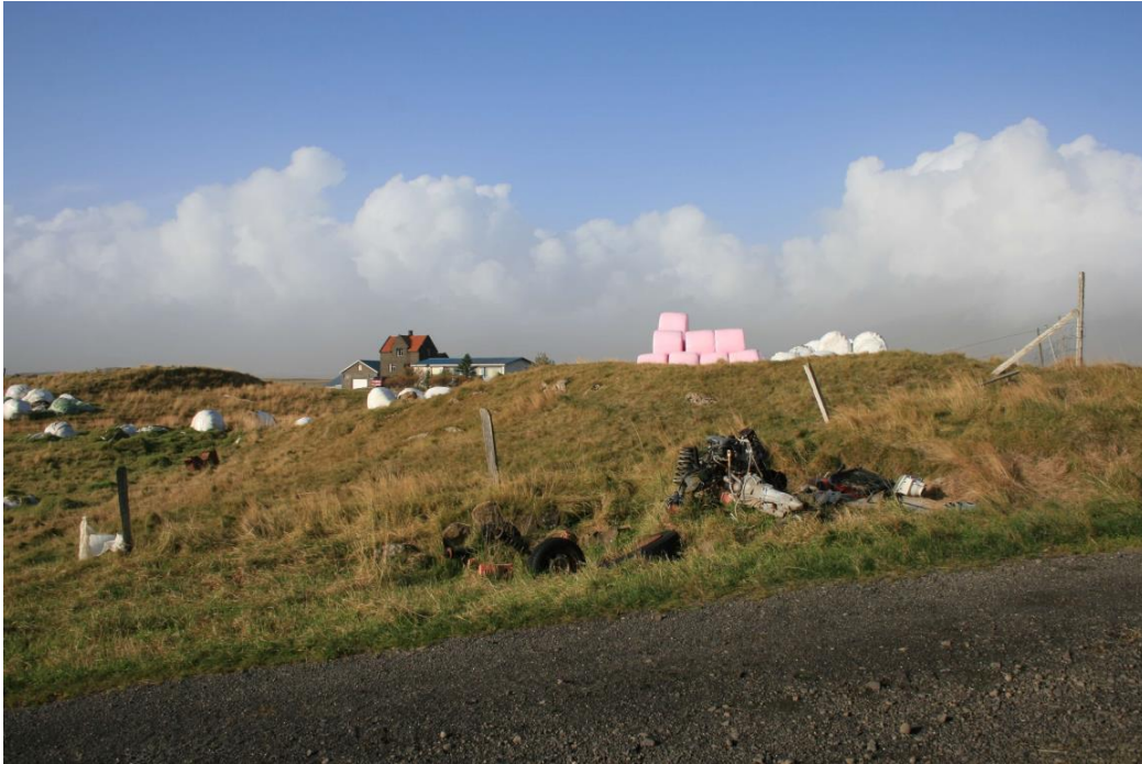
Mynd 3. Mannvirki við vesturjaðar framkvæmdasvæðis. Horft til norðurs. (Ljós. SGB, okt. 2016).