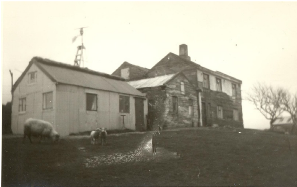
Mynd 2. Eldra bæjarstæði Hólabrekku, hús Sigurðar Filippussonar vestan við eldri bæjarhúsin, horft til norðausturs..