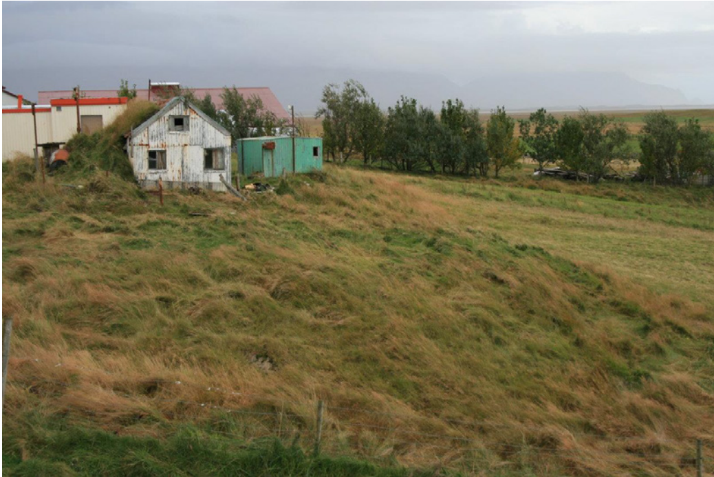
Mynd 1. Hús Sigurðar Filippussonar, horft til austurs. (Ljósm. SGB, okt. 2016).

stærð og umfang þess er áætlað samkvæmt heimildum sem fyrir liggja. Rauðir punktar sýna staðsetningu minja innan skipulagssvæðis.