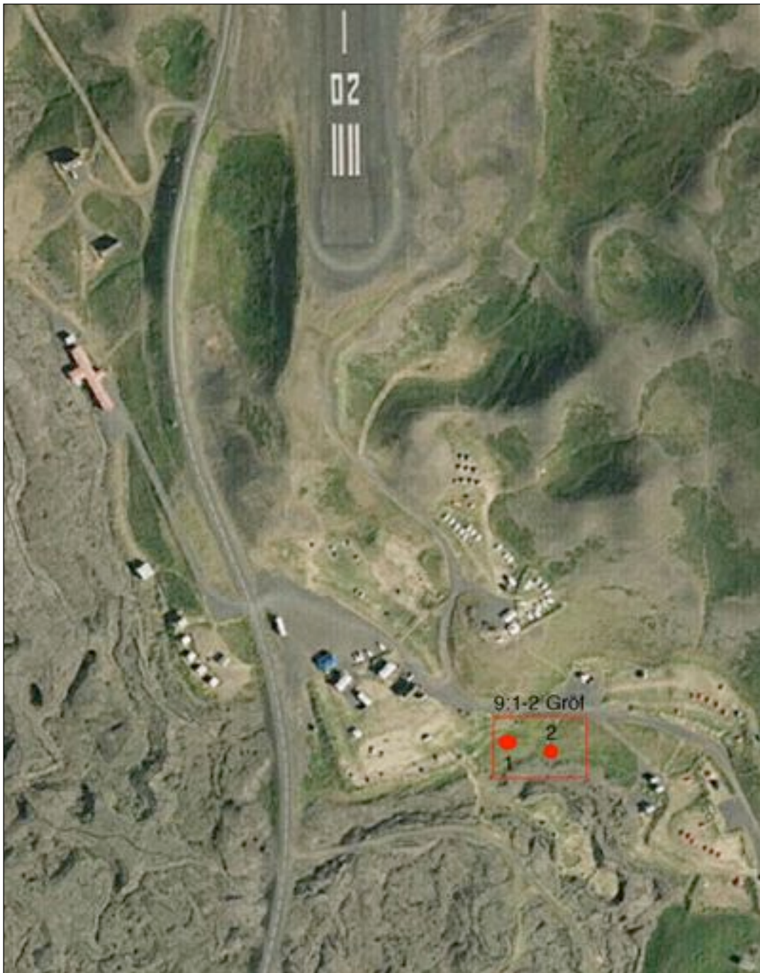
Mynd 1. Staðsetning fornleifa í Hlíð.

Friðlýstum fornleifum fylgir 100 m friðhelgt svæði út frá ystu sýnilegu mörkum þeirra (22. gr). Um friðaðar fornleifar er 15 m friðhelgað svæði umleikis samkvæmt sömu grein. Sú hefð hefur þó komist á að fara ekki of nærri fornleifum og taka tillit til eðlis þeirra og þarfa.