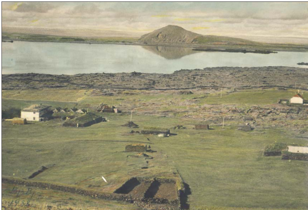
Mynd 2. Myndin var tekin árið 1938 og undirrituð Bj.Bj. Hún sýnir vel ýmsar fornleifar sem í dag eru horfnar, eins og réttina, fjárhús t.h. sem nú er undir íbúðarhúsi, og annað sem hvergi eru heimildir um og er beint niður af réttinni. Á túninu standa taðhraukar hér og hvar, en tað var helsti eldiviður sveitarinnar um aldir. Mó er þar ekki að finna svo nýtanlegt sé.

Í skráningunni er gengið út frá því að skipulagið taki tillit til allra fornleifanna og því eru þær ekki taldar vera í neinni teljandi hættu vegna þess, annarri en tímabundinni. Þurfi hins vegar fornleifar að víkja