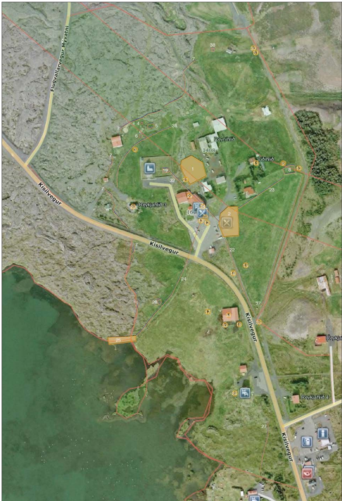
Mynd 3. Staðsetning hinna skráðu fornleifa/minja á skipulagssvæðinu sem kannað var. (Loftm. Loftmyndir ehf. Viðbætur: Fornleifa-fræðistofan).