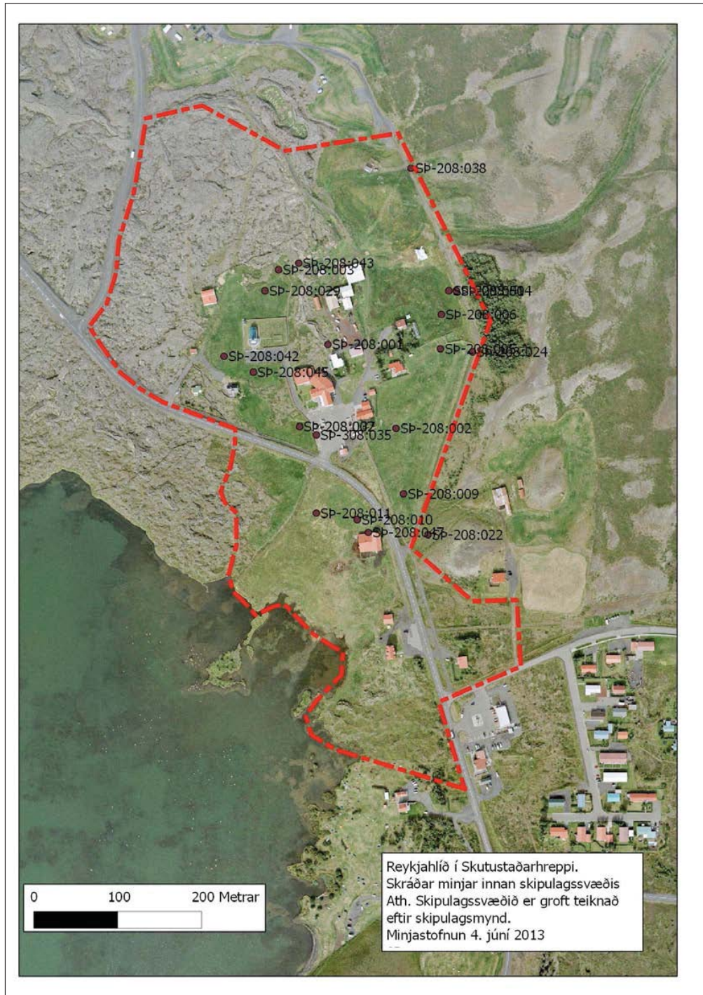
Mynd 1. Deiliskipulagssvæðið og þær fornleifar sem skráðar voru 1999. Þetta er ónákvæmt kort og ber að horfa fram hjá því, enda gömul GPS tæki notuð. (Mynd: Loftmyndir ehf. Viðbætur: Minjastofnun Íslands).