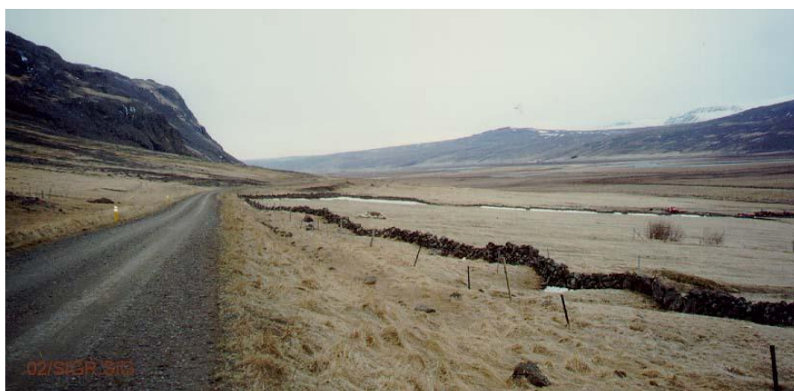
Hjallaland - 144711-181-13 Túngarður