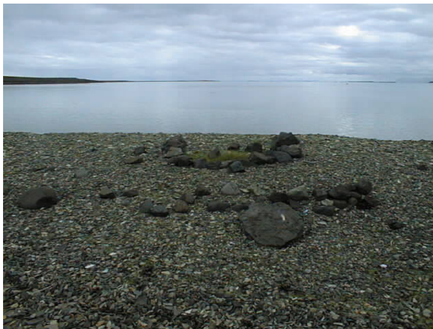
Mynd 1. Naust yst á Hjarðarbólsoddanum norðanverðum (nr. 34:1-2). Steinaraðirnar sýna innri og ytri brún gaflsins. Í byrjun þessarar aldar var gert út á hrognkelsa frá þessu útræði. Horft er til NA.