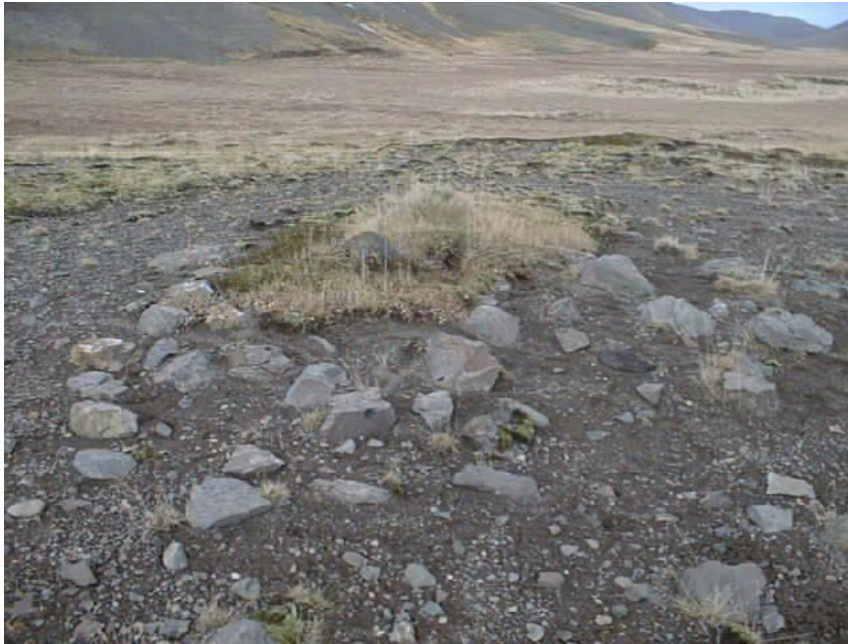
Mynd 3. Dysin (kumlið? nr. 41:1). Horft er til NNV. Ljós. B.F.E.

Ástæða þykir að friðlýsa þrjár fornleifar á svæðinu. Þær eru; fornlegar rústir í Kotamýri, nr. 37:1-2 og Dysin, sem gæti verið kuml, nr. 41:1.