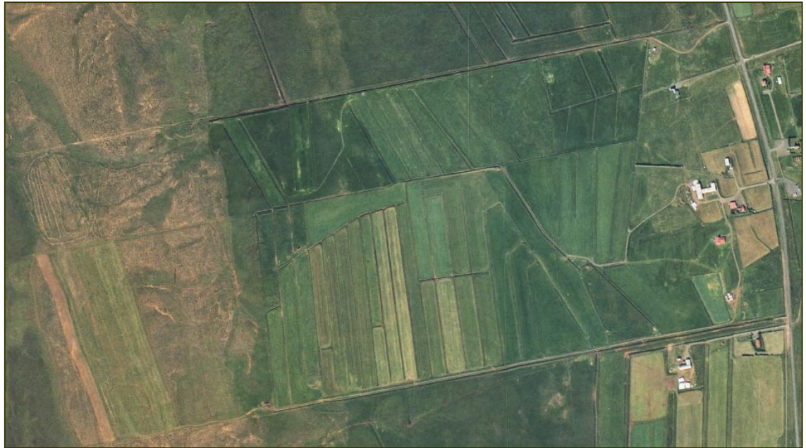
Hátúnsland með Miklagarði vestan Sauðárkróksbrautar. Loftmynd frá Loftmyndum ehf. frá 2000.

Stundum sjást fornleifar ekki í landslaginu, þótt þeirra sé getið í heimildum. Kanna margar ástæður að vera fyrir því. Kemur þá fram í fornleifaskránni að gengið er út frá „heimild“ um t.a.m. vatnsmyllu og er hún þá skráð sem slík. Leitast er við að hafa fornleifaskrána eins nákvæma og kostur er, því að leifar fornminja kunna að leynast í jörðu þótt ekki sé unnt að sjá þær með berum augum á yfirborðinu. Hafi fornminjarnar sérnafn, t.d. Fingurbjörg eða Meðalheimur, þá er það sérstaklega skráð. Ef sérnafni er ekki til að dreifa kemur fyrir að hlutverki minjanna er lýst þar sem sérnafn stæði annars, t.d. fjárhús eða vatnsból.