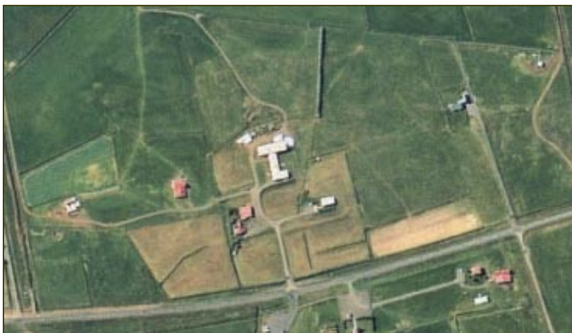
Hátún og Mikligarður árið 2000