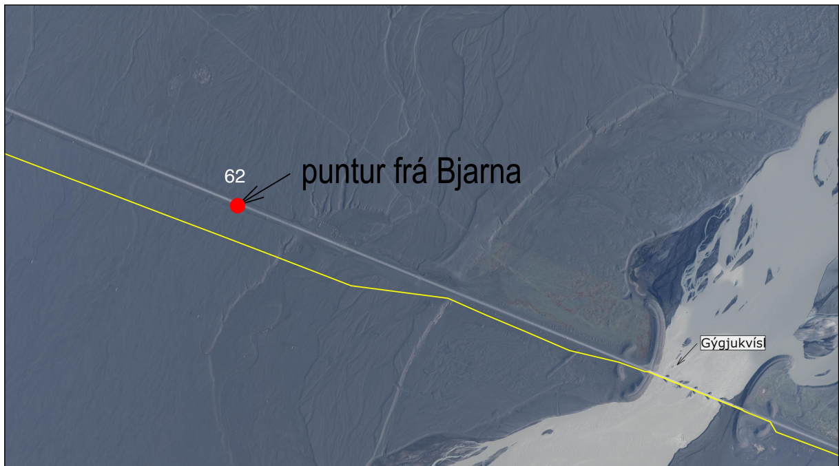
Mynd 3. Staðsetning Sýslusteinsins á Skeiðarársandi.