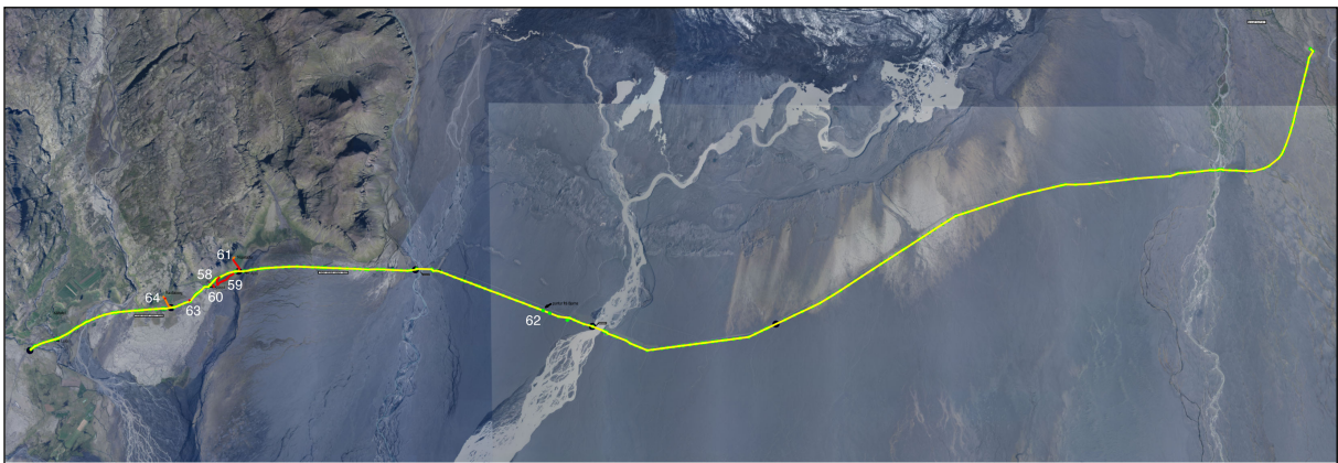
Mynd 1. Yfirlit yfir alla leiðina með fornleifum. (Viðbætur: Orkufjarskipti hf-Fornleifafræðistofan).

Því eru allar þær fornleifar á könnunarsvæðinu sem og annarsstaðar og eldri eru en 100 ára, friðaðar skv. lögnum.